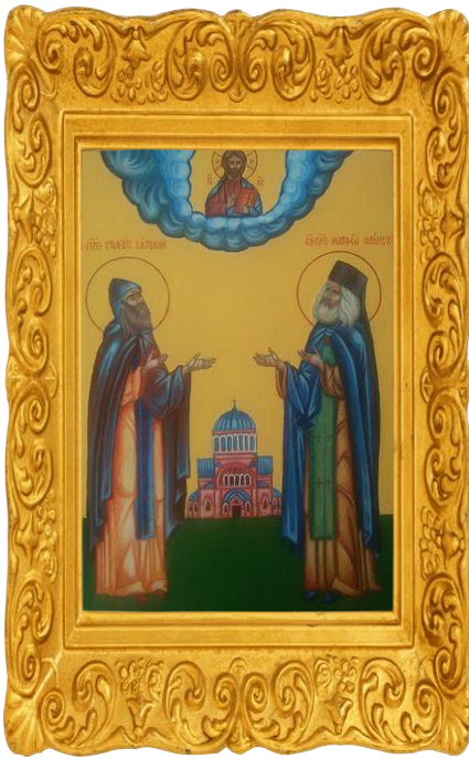
Учитель и ученик, Преподобные Стефан Филейский и Матфей Яранский