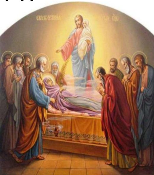
Успение Пресвятой Богородицы

в Московском подворье Свято-Троицкой Сергиевой лавры.